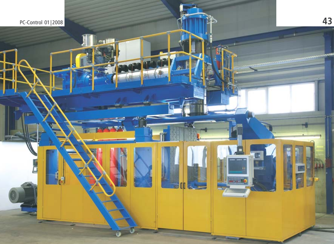
Kunststoffblasformmaschine zur Herstellung von Fässern, Tanks und technischen Teilen